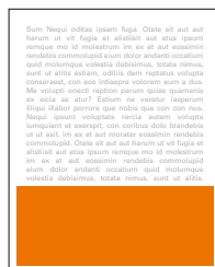
1/3 strany na šířku 205x90 mm čistý formát 175x80 mm na zrcadlo