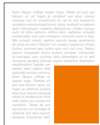
1/4 strany na výšku 100x136 mm čistý formát 85x120 mm na zrcadlo