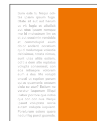
1/2 strany na výšku 100x275 mm čistý formát 85x248 mm na zrcadlo