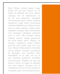
1/3 strany na výšku 71x275 mm čistý formát 55x248 mm na zrcadlo