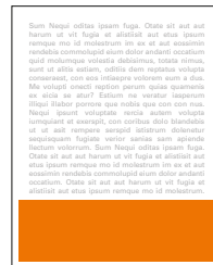
1/4 strany na šířku 205x75 mm čistý formát 175x60 mm na zrcadlo