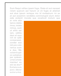
JUNIOR PAGE 131x176 mm čistý formát 117x161 mm na zrcadlo